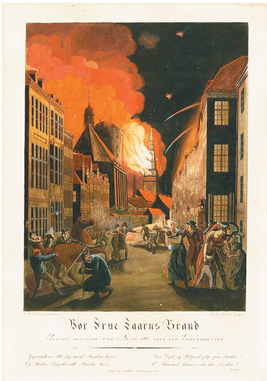
Landemærket under bombardementet. C.W. Eckersberg

"Denne sidste nats rædsler mindes jeg grant: på at sove var ikke at tænke hverken for voksne eller børn, hele himlen stod i lue, alle vegne, hvor vi så rundt, hvirvlede flammer i vejret, og gennem den tykke luft, som var opfyldt med regn, kom lyn på lyn og knald i knald af raketter og bomber.