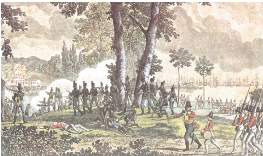
Udsnit af C.W.Eckersbergs "Udfaldet i Classens Have"