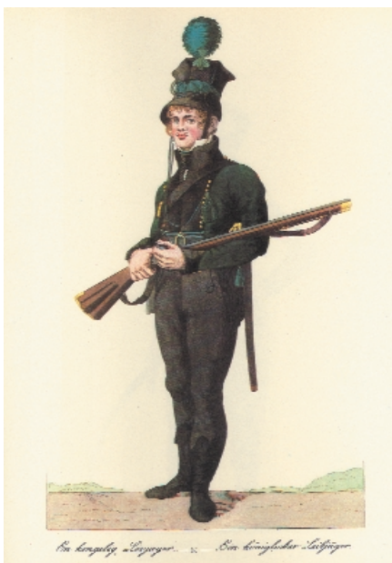
En Kongelig Livjæger Tegning af Johannes Senn

"Langsmed brystværnene stod infanteri, og i bastionerne lå artilleristerne lejrede om kanonerne, medens den såkaldte "anden afdeling" i små troppe eksercerede