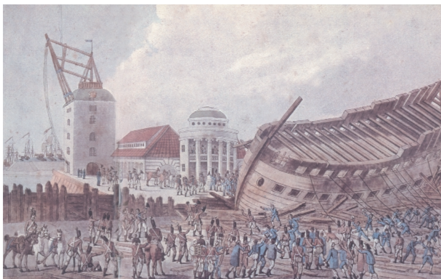
"Englændernes sidste skændselsdåd". C.W. Eckersberg. Englænderne ødelagde linieskibet Ditmarsken i dokken og tre skibe på stabelen på Nyholm.

27 Holmen. I flådens leje, der var afgrænset af en række forbundne, nedrammede pæleknipper, såkaldte Duc d'Alber, fra Nordre Toldbod i nord til Christiansholm i syd, lå den aftaklede danske flåde, som blev englændernes krigsbytte i 1807. I dag kan man i vandet ud for Mastekranen på Nyholm og Operaen på Dokøen se tilsvarende pæleknipper, der afgrænser det militære område, hvor civil sejlads er forbudt. Mange af de karakteristiske bygninger på Holmen