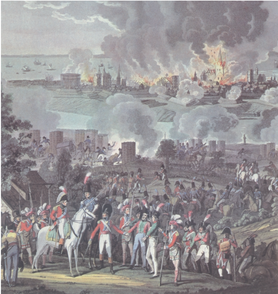
Det brændende København set fra de engelske belejringsbatterier. I.L. Rugendas

12 Metropolitanskolen , der lå i tæt ved domkirken i Dyrkøb, blev totalt ødelagt, da Frue Kirke styrtede sammen under englændernes bombardement. Efter krigen blev skolen genopbygget af C. F. Hansen i nyklassicistisk stil i Fiolstræde øst for domkirken. Bygningen bruges i dag af Københavns Universitet, mens skolen er flyttet til nye lokaler i Struensegade 50 på Nørrebro.