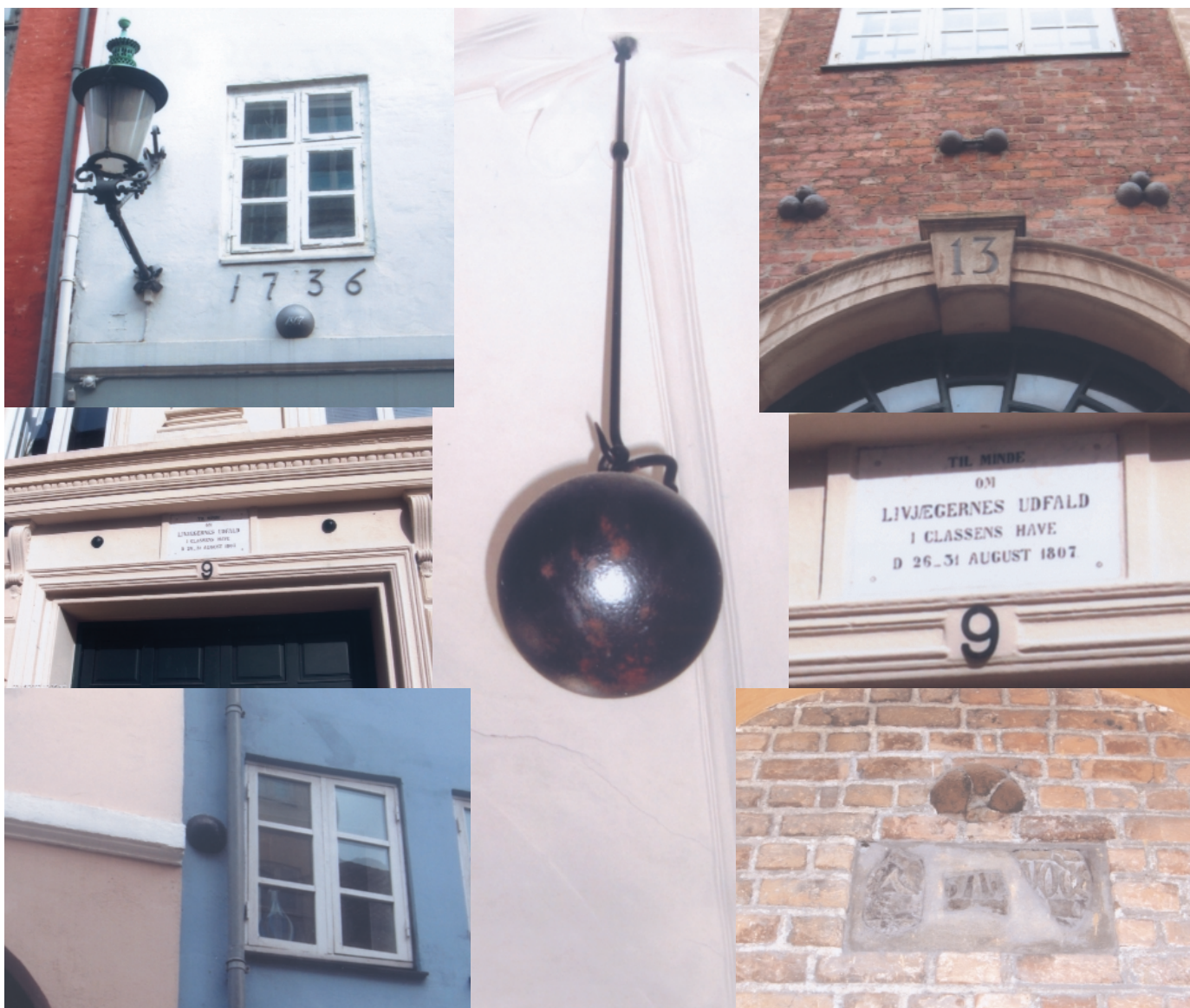
Kanonkugler og mindeplader i Københavnske husfacader

vejs, så der opstår undertryk. Derved suges flammerne fra omliggende brande ind mod centrum, idet alle de mellemliggende bygninger efterhånden antændes af ildstormen.