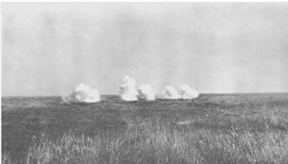
Hand-grenades shot from a gun! Aarsen grenades burst in the open.

Det er nærliggende at antage, at herren bag skydelinjen er ingeniør Aarsen.