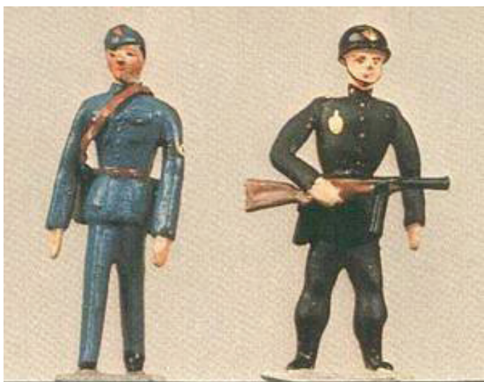
Brigader Statuette: Et CBU "Føl" og en politibetjent med stålhelm og maskinpistol.

Føllet hører mig bekendt ikke til standardserien og er givet et eksempel på en af de specialproduktioner, som Carl Martin Andersen fremstillede gennem årene - på bestilling eller efter eget valg.