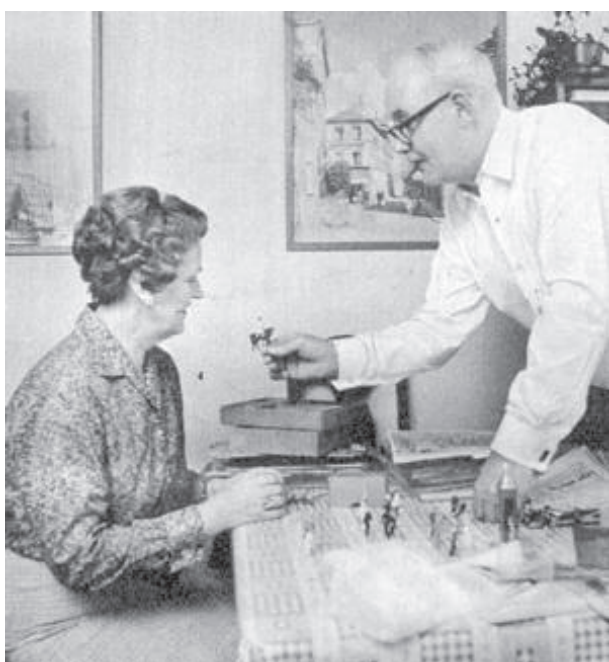
Fru Andersen diskuterer en detalje ved en rytterfigur med sin mand.