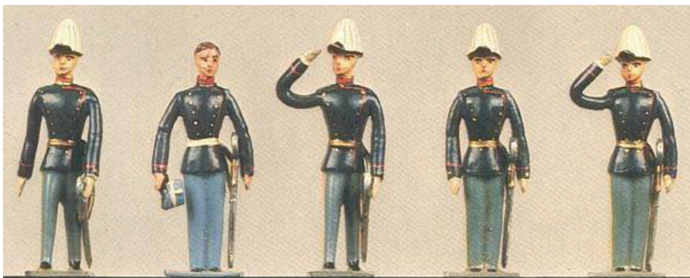
Brigader Statuette: Infanteriofficerer