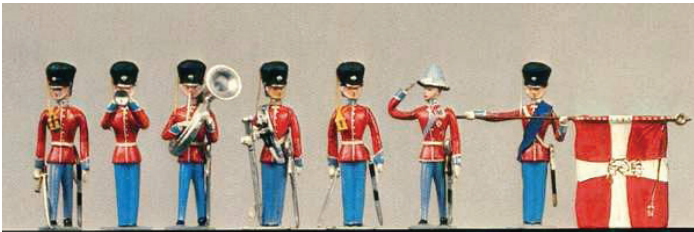
Brigader Statuette: Den kongelige Livgarde.

De følgende billeder af Brigader figurer er uddrag af en plakat, som jeg købte på Loppetorvet på Israels Plads en gang i 1980'erne. En af de handlende havde dem i massevis og da den er ganske flot i sig selv, så undlod jeg ikke at købe et eksemplar.