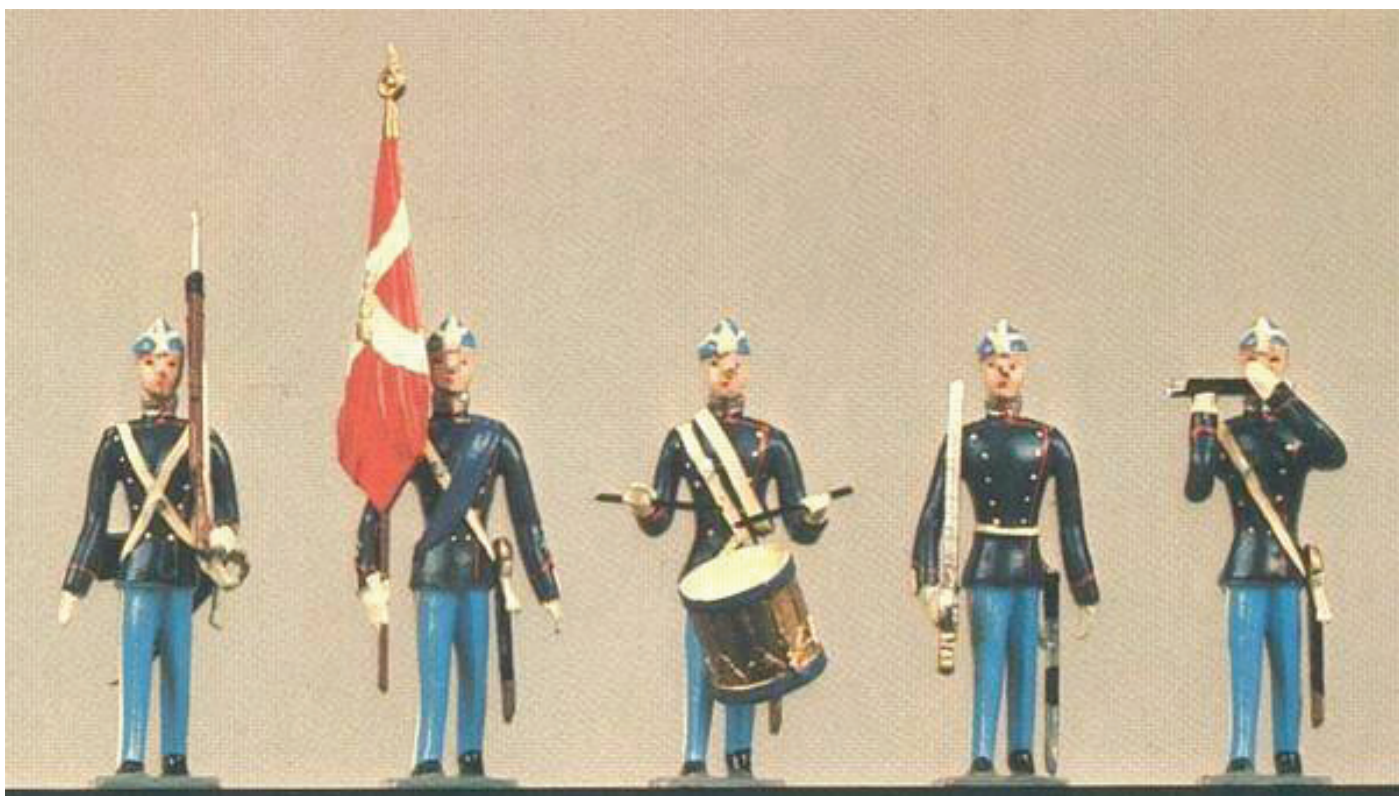
Brigader Statuette: Den kongelige Livgarde.