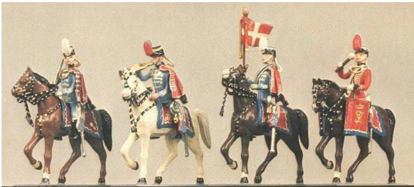
Brigader Statuette: Gardehusarregimentet.