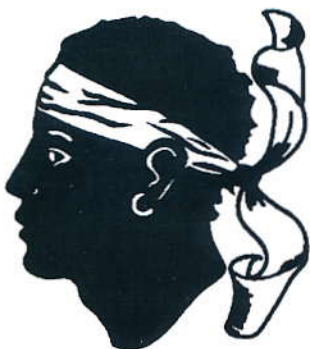
Korsikas våben - det mauriske hoved med torklædet om hovedet.

Corsica insula est stod der i vor første latinske læsebog, og Seneca omtaler landet som en vild og stormombrust klippe. Der står også et romantisk skær om navnet Korsika, dets indbyggers stræben for frihed og uafhængighed, dets klaner og vendetter. Kendt er også James Boswell's beskrivelse af øen fra 1765, som fik stor indflydelse på samtiden. Gennem årtusinder havde befolkningen været genstand for undertrykkelse af indvandrende nationer, helt tilbage fra fönikerne og romernes tid. General Pasquale Paoli ledte i 1755 en frihedsbevægelse og styrede landet som en uafhængig republik. Da Genoa ikke kunne fordrive ham, solgtes øen i 1768 til Frankrig som generobrede den, og Paoli måtte søge asyl i England 1 . Korsika blev derefter styret som en provins og siden 1790 integreret i den franske stat. Under den 2 verdenskrig blev øen igen besat, først af italienske og så af tyske tropper, men korsikanske patrioter gjorde oprør og fordrev i efteråret 1943 garnisonen.