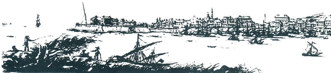
Ajaccio i slutningen af det XVIII århundrede (samtidigt stik).

er dekoreret med familien Bonaparte våbenskjold 3 . Da Paolis parti med understøttelse af engelske tropper overtog magten i 1793, måtte familien Bonaparte flygte til Frankrig. Huset plyndredes, inventar og selv døre og vinduer blev fjernet. Engelske soldater benyttede den underste etage som forsyningsdepot og stueetagen som kvarter for officerer 4 . Det menes at bygningen også blev stukket i brand og noget af murværket nedbrudt. I alle tilfælde, da franske tropper tre år senere generobrede øen tilkendtes Letizia Bonaparte ( Madame Mère , Napoleons moder som da var enke) en betydelig skadeserstatning, så huset kunne genopbygges. Nye møbler blev indkøbt fra Genua og Marseilles i 1796-97, men familien boede der kun nogle få år, og indboet kom senere i Letizias fætters eje. En del generhvervedes af Napoleon III og befinder sig i museets samling. Rummenes oprindelige farver er så vidt muligt genskabt og der er opsat replica af de originale tapeter. Det er imidlertid forgæves at man søger Napoleons hjem som han har kendt det som barn, og den eneste gang han har beboet det "nye" hus var nogle få dage i oktober 1799 på tilbagerejsen fra Egypten.