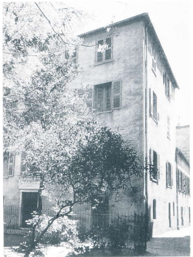
Familien Bonapartes hus i Ajaccio.

Familien Bonaparte havde i slutningen af det XVII århundrede erhvervet huset i rue Malerba (nu rue Saint-Charles )