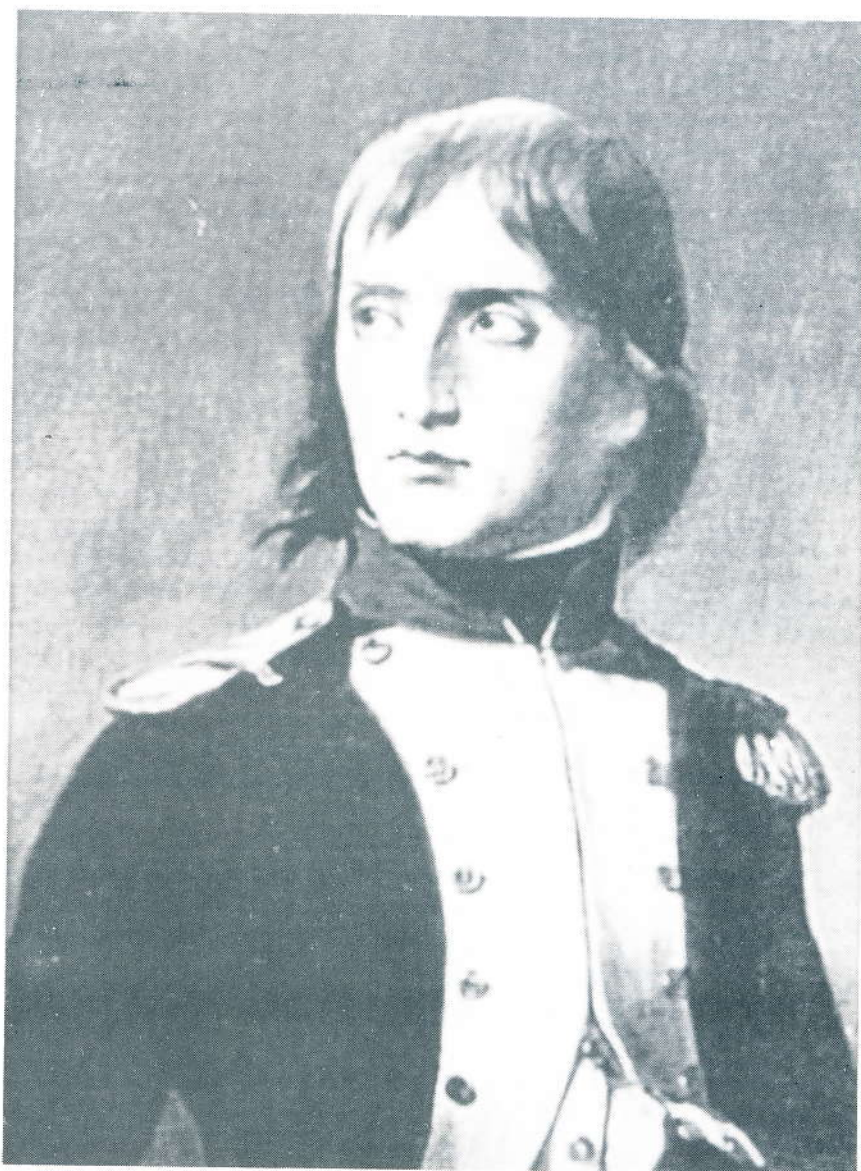
Napoleon Bonaparte som oberstløjtnant i den 2. bataillon af den korsikanske nationalgarde, 1792-93; malet af Henri Philippoteaux (1815-84). Nationalforsamlingen havde ved lov af 19 juli 1790 besluttet at uniformen skulle være ens for alle nationalgarderegimenter: Blå kjole med hvidt for, røde ærmeopslag og rabat med hvid kantning, hvid krave med rød kantning. Maleriet er postumet, og viser fejlagtigt uniformen fra 1789 med rød krave og hvide ærmeklapper.

Besøget slutter i kælderen, hvor man kan se en række billeder der illustrerer familien Bonapartes daglige liv, deres oliven- og vinmarker, den ældste broder Jo-