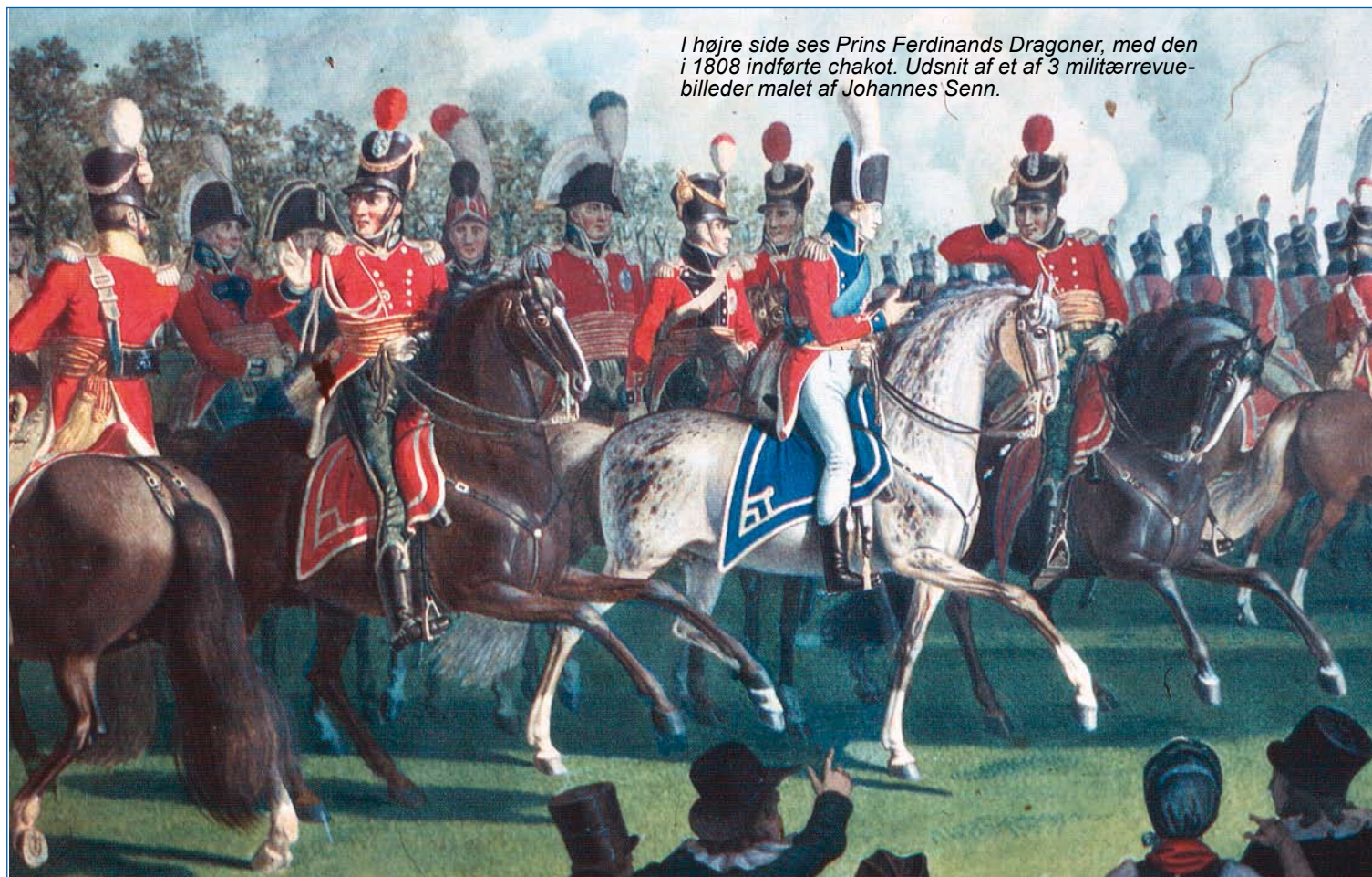
I højre side ses Prins Ferdinands Dragoner, med den i 1808 indførte chakot. Udsnit af et af 3 militærrevuebilleder malet af Johannes Senn.

Støbning af pallask- og sabelklinger er problematiske, fordi ▶