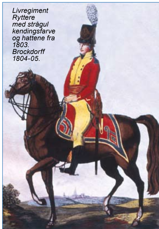
Livregiment Ryttere med strågul kendingsfarve og hattene fra 1803. Brockdorff 1804-05.