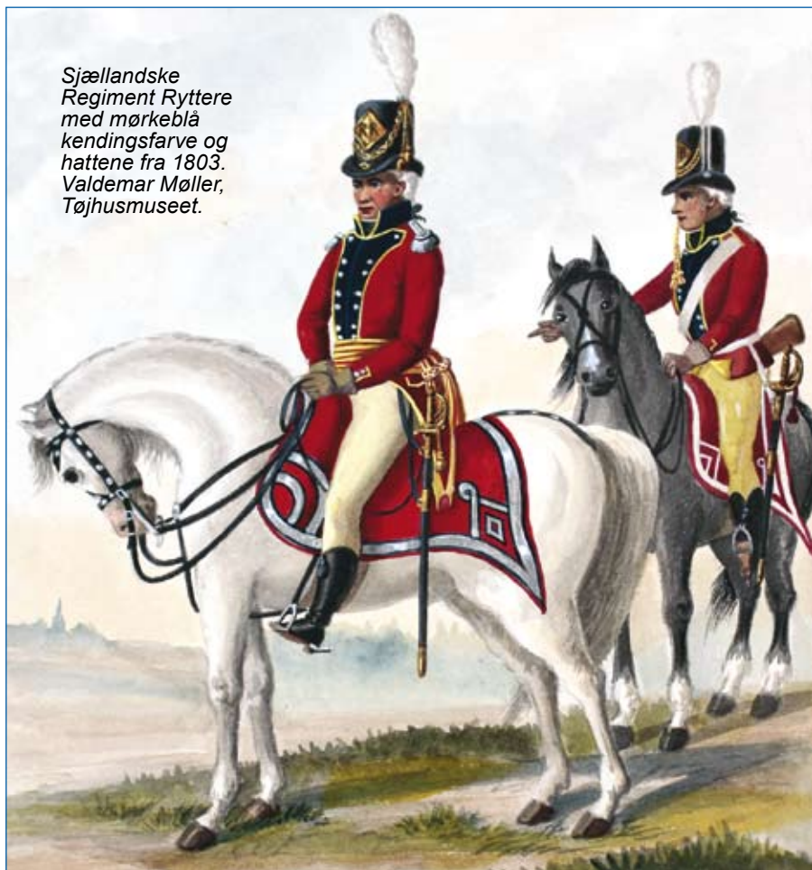
Sjællandske Regiment Ryttere med mørkeblå kendingsfarve og hattene fra 1803. Valdemar Møller, Tøjhusmuseet.

Endelig skal det nævnes, at Exerceer-Reglement til Hest, Kbh. 1808 er en primær kilde, når man vil gøre sig klart, hvorledes det danske kavaleri skulle operere såvel under felt- som vagttjeneste. Her finder man de foreskrevne opdelinger i Regiment, Eskadron, Division og Deling, hvorledes man opstillede i to geledder og i kolonne med fire roder. Der gives detaljerede instruktioner i afvikling af specialrevue, af deployeringer, af angrebsformer og af saluteringsformer med sabel og pallask – hvilke er noget anderledes, end det ses i dag.