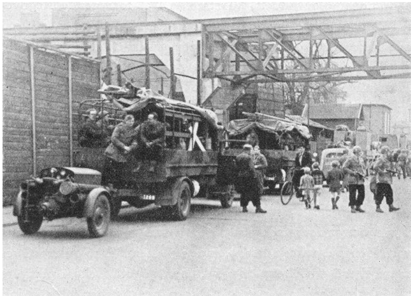
Nogle af Brandkommandoets brandgruppevogne, Helsingborg, 5. maj 1945. Fra Kilde 1.

Brandkommandoets organisation og funktion var modelleret efter de danske CBU-kolonner. Opgavemæssigt var der dog den forskel, at Brandkommandoet forventedes at løse opgaver under kamp og beskydning, mens CBU-kolonnerne løste deres opgaver efter et luftangreb.