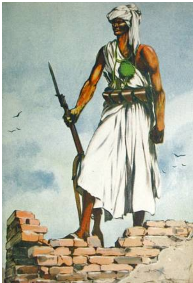
Dubat - Somalia Italiana, ca. 1936.

Fra et samtidigt italiensk postkort set til salg på Internettet.