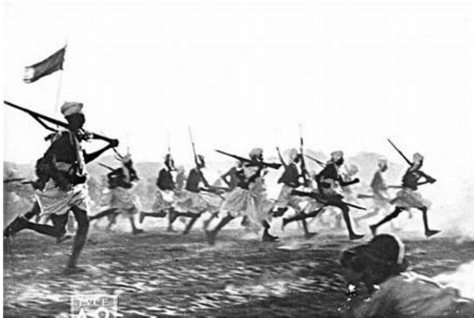
Grænsesoldater (Dubat) fra Italiensk Somaliland, 5. marts 1936 8 ). Fra Campagne d'Ethiopie 1935-36 (Forum Italie 1935-45).

En mægling kom i stand, men resultatet, der kom 3. september 1935, gjorde ingen af parterne ansvarlige, idet begge parter havde antaget, at de befandt sig på eget territorium 7 ). Fra italiensk side var man reelt ikke interesseret i en løsning på grænsestridighederne, og den blev påskuddet for at gå i krig mod Etiopien. Den 3. oktober 1935 rykkede de italienske tropper ind i Etiopien.