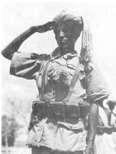
Underofficer fra grænsetropperne

Uniformen var en traditionel somalisk klædedragt, som ud over turbanen omfattede et "slag", der blev båret over højre skulder, samt en "kilt", begge dele benævnt futa .