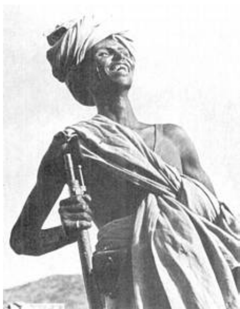
Soldat fra grænsetropperne (Dubat) i Italiensk Somaliland, ca. 1935. Fra Kilde 1.

Under FN-missionen i Somalia 9 ) - Operation Restore Hope - fra 9. december 1992 til 4. maj 1993 deltog bl.a. enheder fra de italienske faldskærmstropper i bevogtningen af den italienske ambassade i Mogadishu.