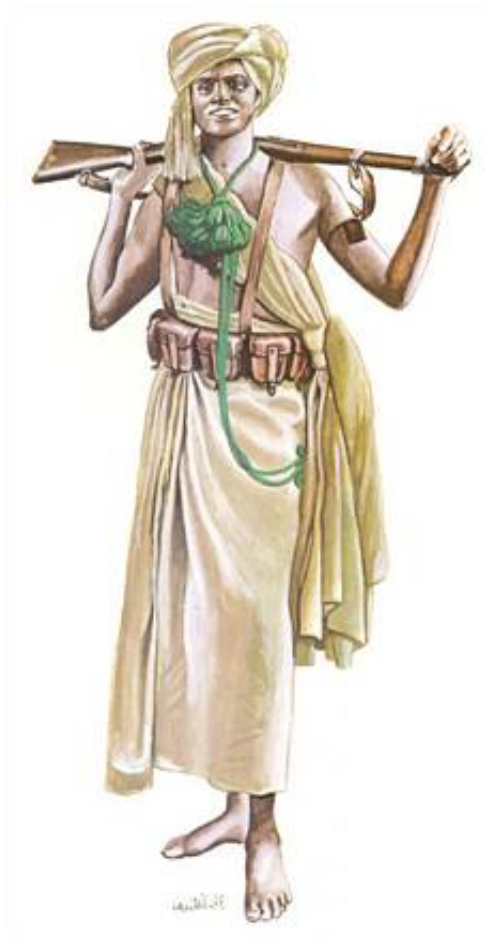
Oversergent af grænsetropperne (Dubat) i Italiensk Somaliland, ca. 1935. Fra Kilde 1.

Uniformen var en traditionel somalisk klædedragt, som ud over turbanen omfattede et "slag", der blev båret over højre skulder, samt en "kilt", begge dele benævnt futa .