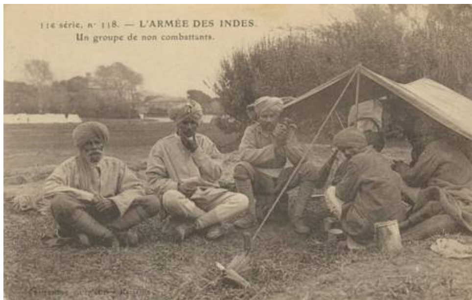
Indiske civile hjælpere, Marseilles, 1914. Fra et samtidigt postkort, afsendt 13. februar 1915.

Hvorledes dette korps mærke har set ud, er jeg ikke klar over, men soldaten til venstre fører et skuldermærke med korpsets forkortede navn - ABC - på sin turban. De tre nedadvendte vinkler på venstre underærme markerer mere end 12 års tilfredsstillende tjeneste, og de to lodrette bjælker, at soldaten har været såret to gange. Ordensbåndene er Indian General Service Medal og 1914 Star . Analogt med engelsk praksis var sygebærerne nonkombattanter, og derved ubevæbnede.