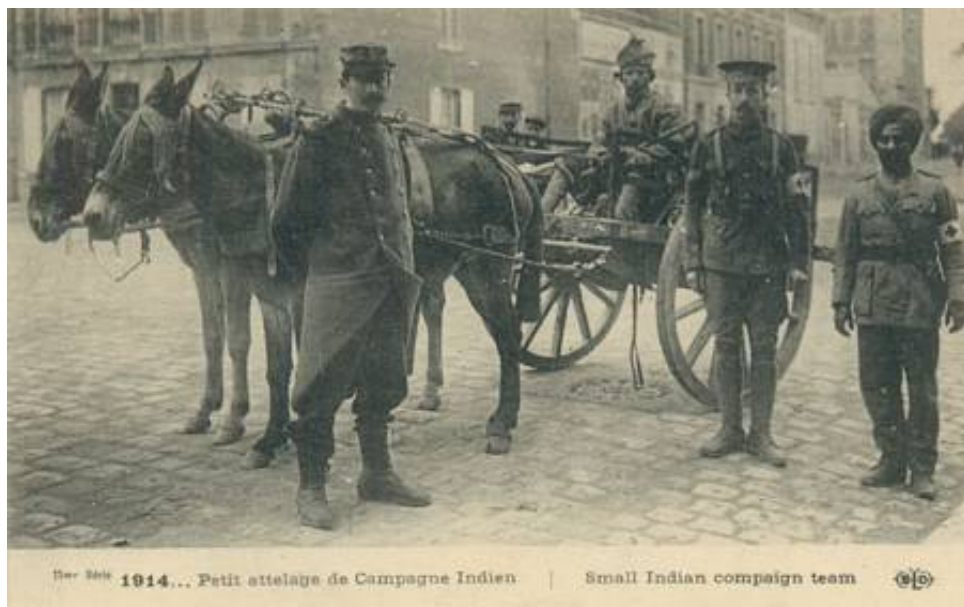
Muldyrkærre (AT Cart), Frankrig, 1914.