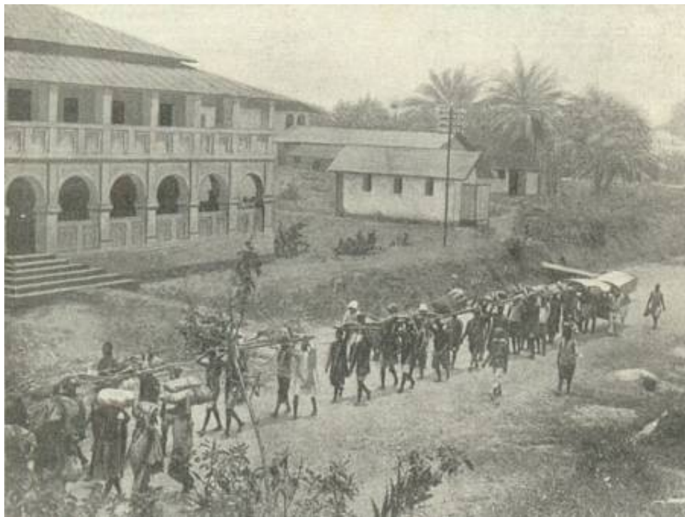
Indfødte bærere transporterer sårede, Kamerun 10 , ca. 1915.

Ekspeditionskorpsset medbragte, bortset fra en sektion med 10 motorordonnanser, intet kørende materiel. I stedet anvendtes et indisk Coolie Corps bestående af 508 bærere, foruden et stort, men ukendt, antal afrikanske bærere, hvervet i Mombasa.