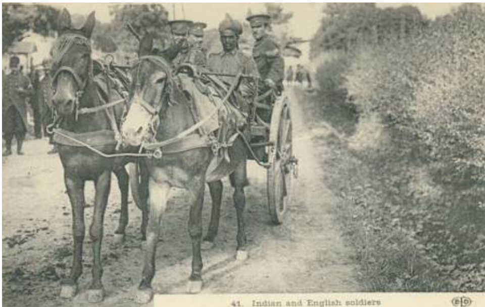
Muldyrkærre (AT Cart), Frankrig, 1914. Fra et samtidigt postkort.

Eksempelvis indgik, fra sommeren 1918. 154 th , 166 th og 165 th Camel Field Ambulance i 10 th Division, i Palæstina 5 .