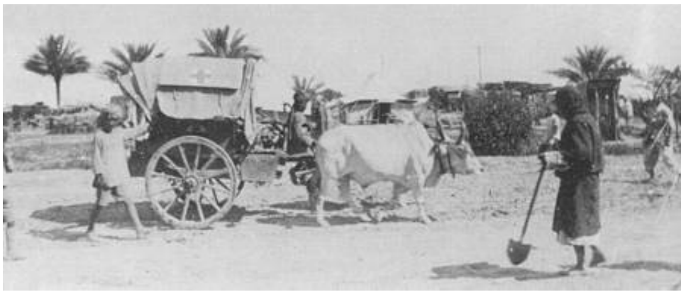
Oksekærre (Tonga), Mesopotamien. Fra Kilde 8.

De indiske feltambulancer, der blev sendt til Frankrig i 1914, blev udrustet med muldyrkærre, mens oksekærre og kameler blev anvendt under varmere himmelstrøg. Her oprettedes også egentlige kamelbårne feltambulancer.