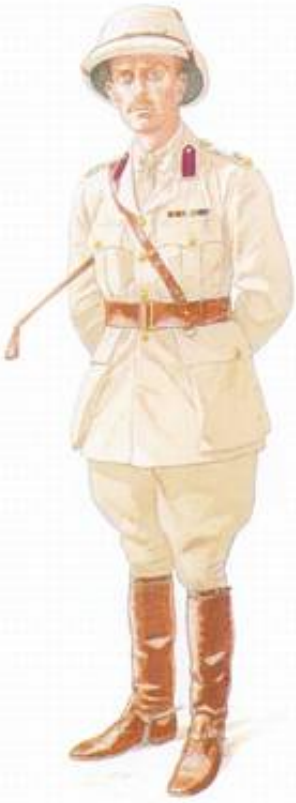
Major, Indian Medical Service, Mellemøsten, ca. 1916. Fra Kilde 8.

Det indiske Ekspeditionskorps D, hvis første enheder gik i land syd for Basra den 6. november 1914, omfattede bl.a. 6 th (Poona) Division 12 ), med følgende sanitetsenheder: