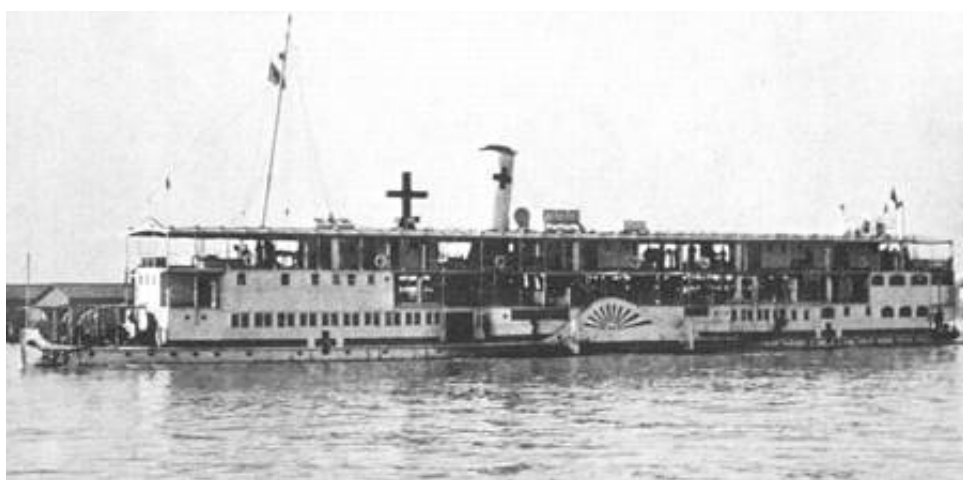
Hospital Paddle Steamer No. 5, fotograferet på Tigris floden 16 .

Til problemerne for sanitetstjenesten hørte, at antallet af sanitetsenheder var ikke på niveau med antallet af kæmpende enheder. Man manglede i stor udstrækning læger og øvrigt uddannet personale. Forsyningen af medicin og forbindsstoffer lod også meget tilbage at ønske, og trods sanitetsenhedernes store indsats, led de syge og sårede ekstra. (Kilde 11)