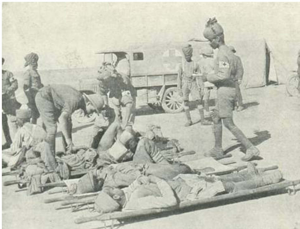
Indisk forbindingsplads i Palæstina, ca. 1918 15 .

Krigens første år afslørede store mangler i forsyningstjenesten og med hensyn til evakuering og pleje af syge og sårede. Først da generalløjtnant Sir Stanley Maude 14 ), med tilnavnet Systematic Joe , i juli 1916 overtager kommandoen i Mesopotamien, kommer der for alvor orden på forholdene.