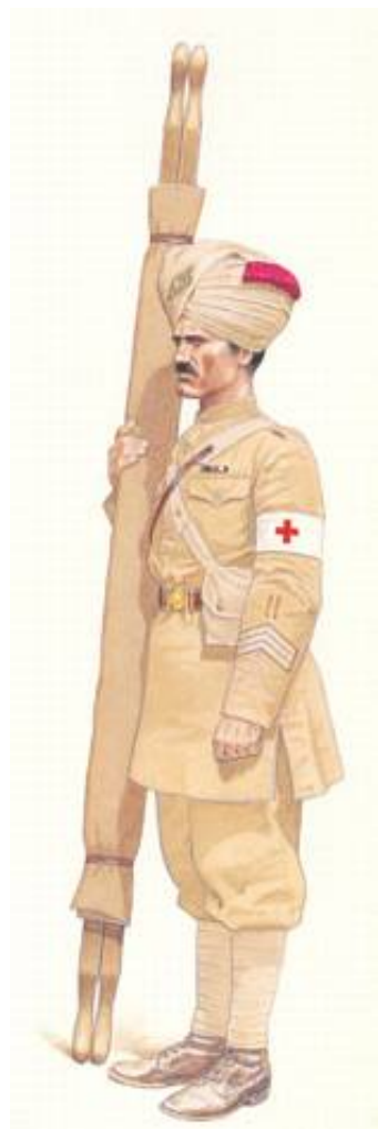
Indisk sygebærer, Army Bearer Corps, Mellemøsten, ca. 1916. Fra Kilde 8.

Sygehjælpere - og fra 1903 også Army Bearer Corps - var organiseret i 10 kompagnier, svarende til den indiske hærs 10 infanteridivisioner, jf. Kilde 3 2 ).