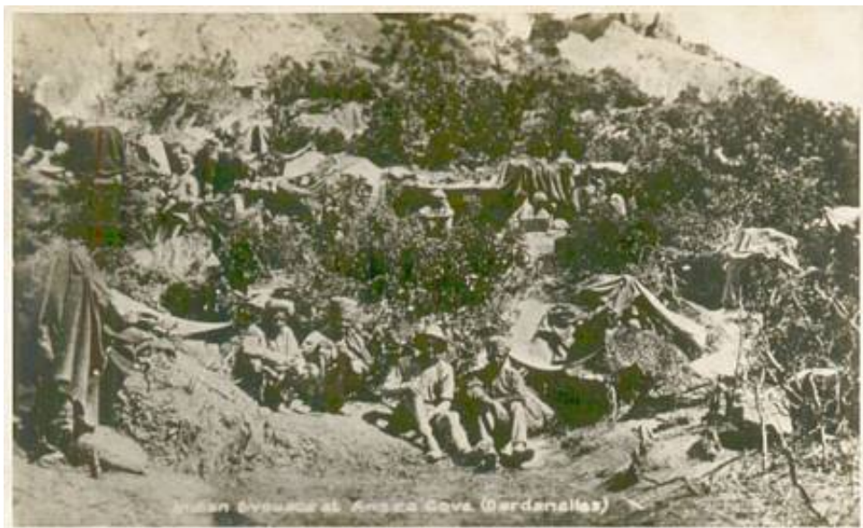
Indian Bivouacks at Anzac Cove (Dardanelles), 1915.