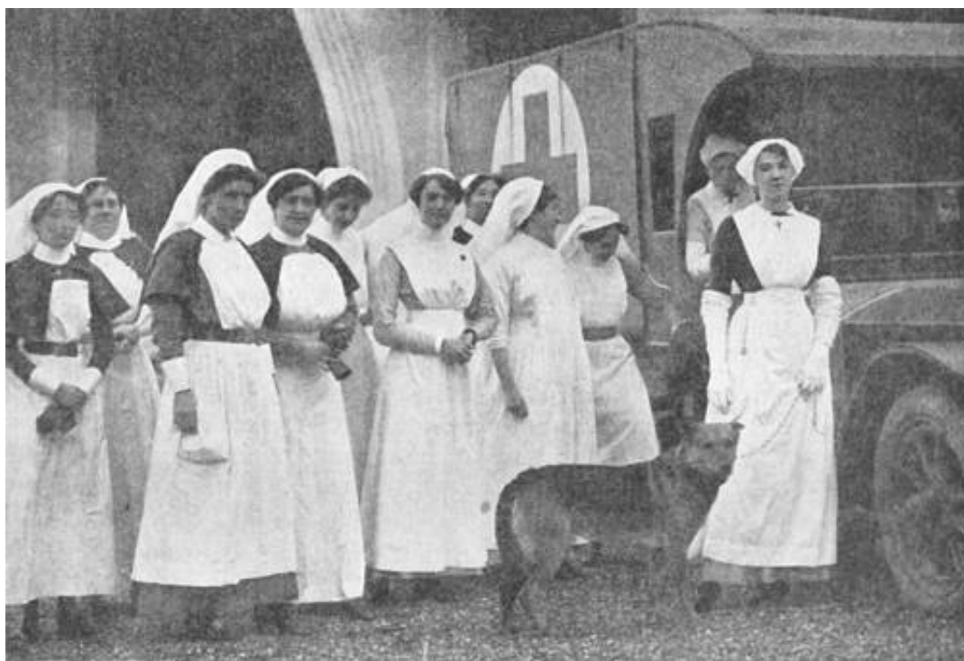
Hertuginde af Westminster sammen med dele af staben ved No. 1 British Red Cross Hospital 2 ).

Hertuginde af Westminster åbnede i oktober 1914 det hospital i Le Touquet 1 ), som frem til juli 1918 bar betegnelsen No. 1 British Red Cross Hospital (Duchess of Westminster's Hospital) . Patienter kunne indlægges her, til de var stærke nok til at klare transporten til videre behandling i England.