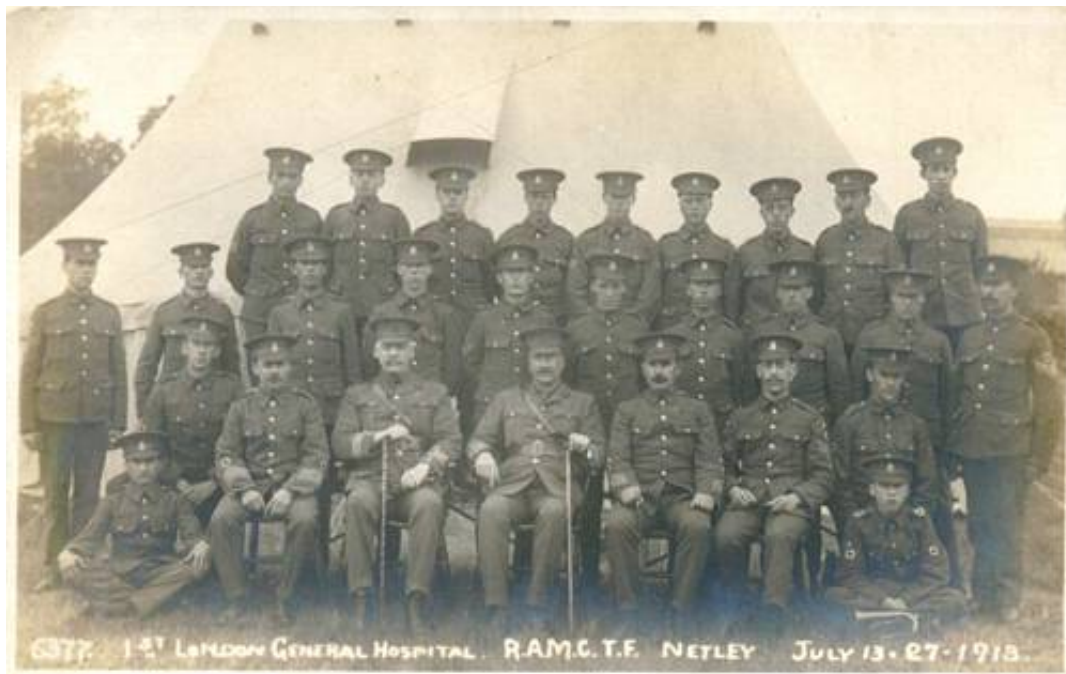
1 st (City of London) London General Hospital, Royal Army Medical Corps, Territorial Force, 13. juli 1913.

Territorial Force spillede også på dette område en væsentlig rolle i organiseringen af sanitetsenheder, herunder de større etablissementer i etapeområderne.