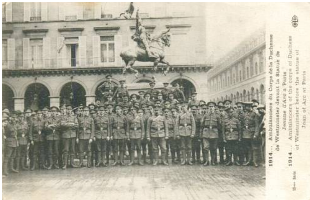
Frivillige ambulancefolk fra No. 1 British Red Cross Hospital. Samtidigt postkort, afsendt 26. december 1914.

Hertuginde åbnede sit hospital i Kasinoet og det havde kapacitet til 260 patienter, heraf 10 officerer.