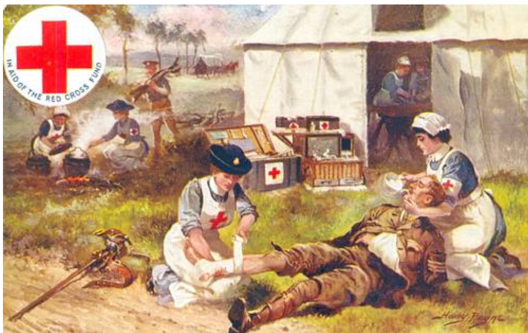
Sygeplejersker i arbejde, ca. 1914. Tegnet af Harry Payne.

Ca. 150 tilsvarende evakueringslazaretter og hospitaler fandtes andre steder på Vestfronten, og de var af hensyn til transportmulighederne placeret nær offentlige samfærdselsmidler, herunder jernbanelinjer.