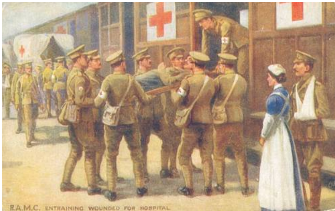
Royal Army Medical Corps, Entraining wounded for hospital, ca. 1915.

De kvindelige sygeplejersker var organiseret i bl.a. Queen Alexandra's Imperial Military Nursing Service, som i august 1914 talte godt 300 kvinder. Ved udgangen af 1914 var tallet vokset til 2.223, og ved krigens slutning til 10.404 uddannede sygeplejersker, suppleret af ca. 9.000 sygeplejersker/sygehjælpere fra organisationen Voluntary Aid Detachments.