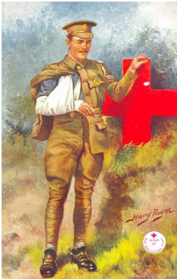
Såret korporal af kavaleriet 4 ), ca. 1914. Tegnet af Harry Payne.