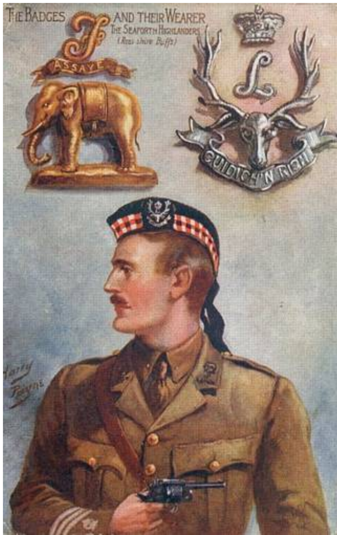
Seaforth Highlanders, ca. 1914. Tegnet af Harry Payne 5 .