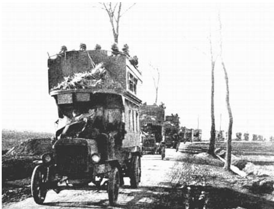
Auxiliary Omnibus Company - Indiske soldater på vej mod fronten, 1914.

Army Service Corps Motor Transport, Grove Park. Fra Kilde 2.