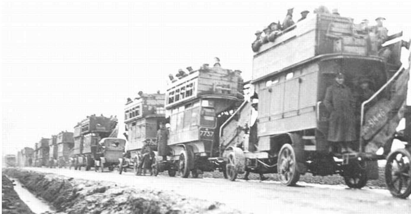
Et Omnibuskompagni fotograferet ved Ypres, ca. 1917. Fra Kilde 5.