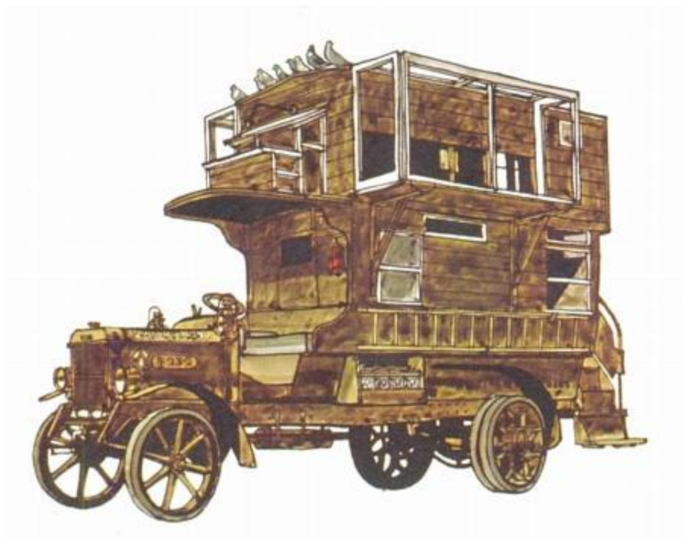
En LGOC B-type bus ombygget til mobilt dueslag.

Flere af soldaterne havde måske hørt om - og endnu færre set - motorkøretøjer, og hovedparten havde givet aldrig prøvet noget sådant før.