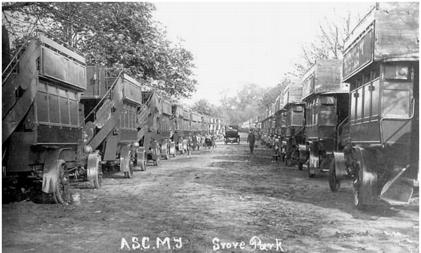
Army Service Corps Motor Transport, Grove Park. Fra Kilde 2.

Busserne fra Tramways var af kom fra bilfabrikken Daimler , mens busserne fra LGOC blev bygget af AEC (Associated Equipment Company), med betegnelsen B-Type bus .