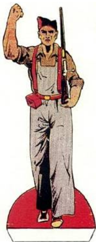
FAI-CNT militssoldat fra Columna Durruti 4