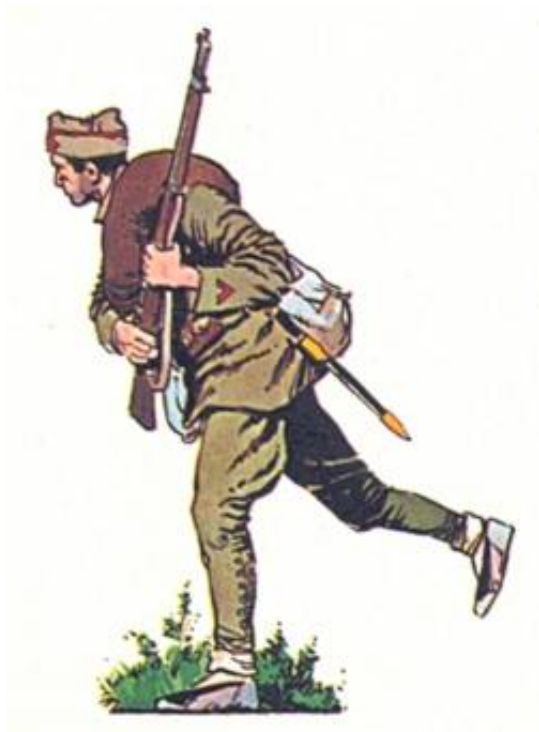
Korporal fra en af de regulære enheder i de republikanske styrker.

Lidt over halvdelen (ca. 8.750 mand, fordelt på 54 kompagnier) forblev loyale over for den republikanske regering og udgjorde nogle af de bedste tropper på i den republikanske hær.