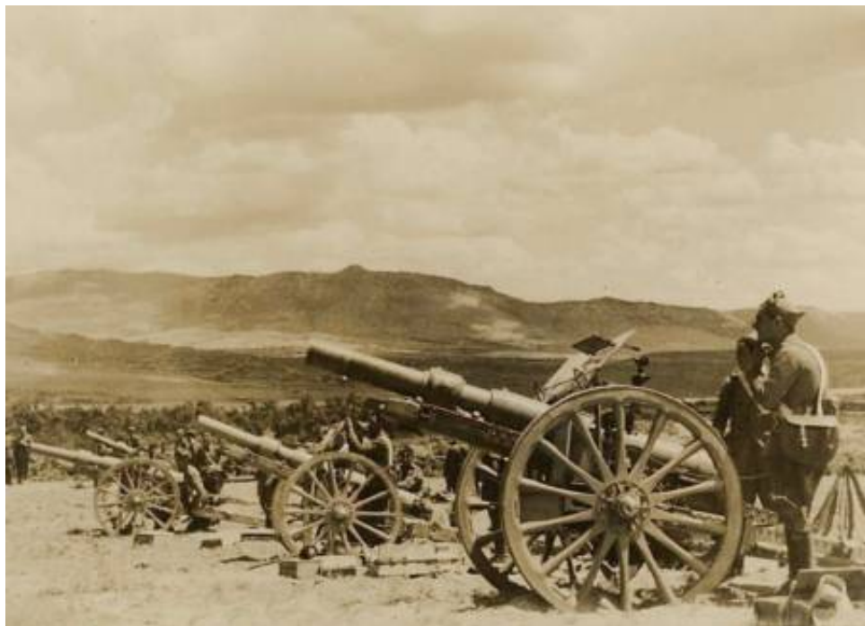
105 mm felthaubits Model 1922.