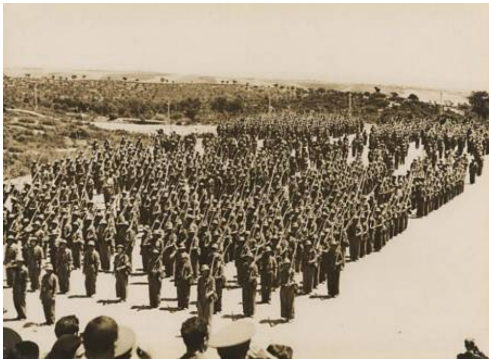
Soldater fra 3 a Brigada Mixta ved en faneoverrækkelse 13. juni 1937.