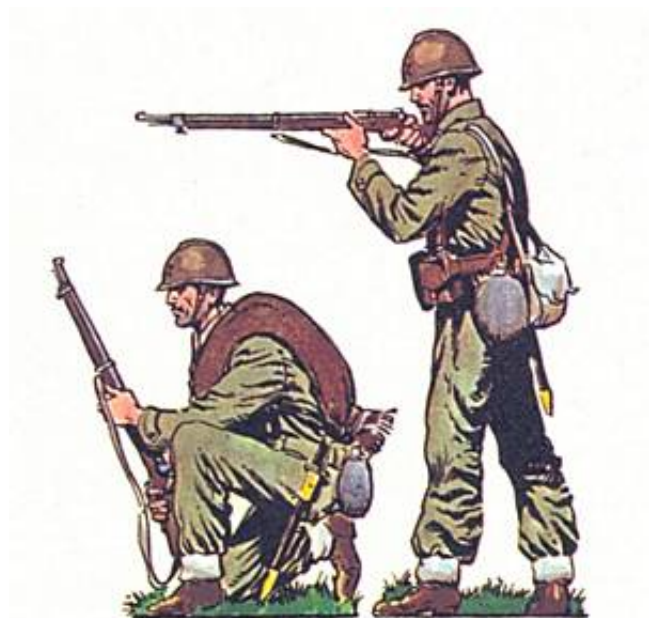
Infanterister fra en af de regulære enheder i de republikanske styrker. Fra Kilde 4.

I Kilde 10 anføres det, at brigaden var udrustet med franske stålhelme af typen Adrian, Model 1926 14 ).