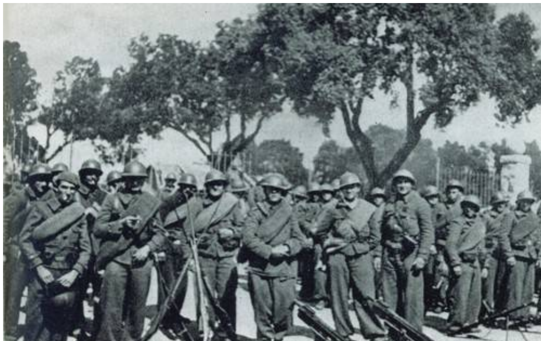
Soldater fra 4. Maskingeværkompagni i 8. Bataljon "Czaplaew", december 1936, hvori sergent Ernsteds maskingeværdeling indgik. Fra Kilde 12.

Bataljonen indgik i den XIII. Internationale Brigade "Dombrowski", men sergent Ernsteds maskingeværdeling var, jf. Kilde 18, tilknyttet 10. Bataljon i december 1936 28 ).