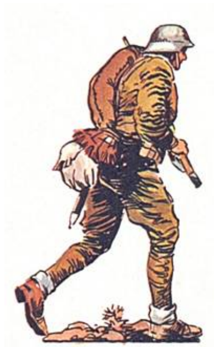
Republikansk regulær soldat.

Hertil kommer bl.a. militsenheder fra Málaga, Ciudad Real, Córdoba og Jaén samt nogle kompagnier marinesoldater, 200 kavalerister og 3 artilleribatterier.