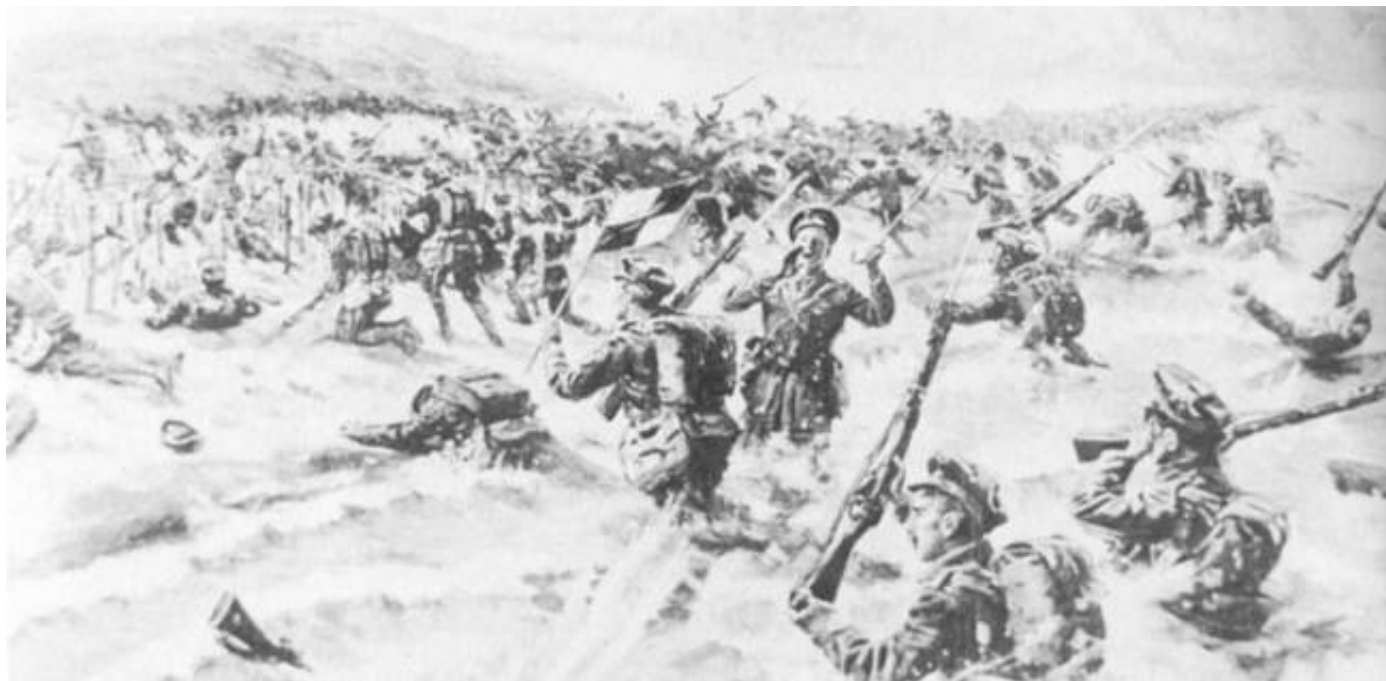
Lancashire Fusiliers går i land på W Beach, Gallipoli, 25. april 1915.