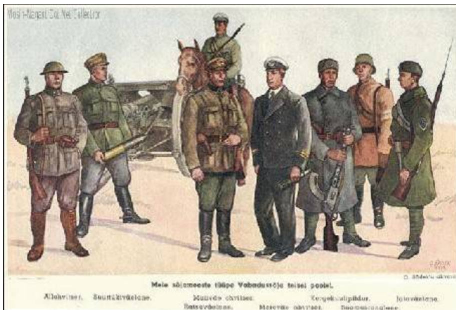
Soldater fra den estiske hær og flåde. Gengivet fra et postkort fra 1930'erne.

Umiddelbart efter Første Verdenskrig blev der fra dansk side givet en eksporttilladelse på 900 stk. 7,7 mm Madsen rekylgeværer til England.